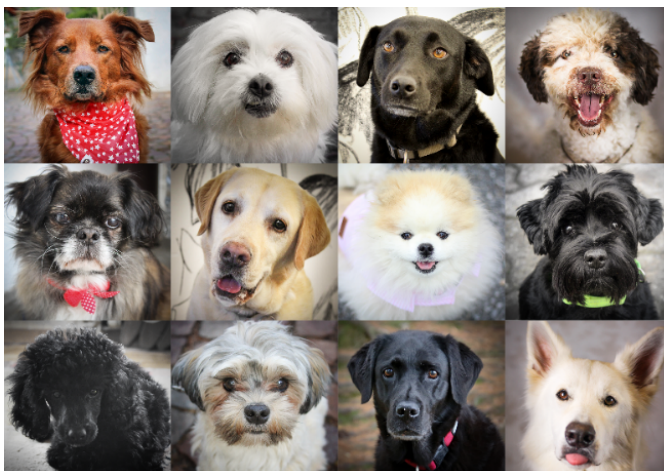
Die Hunde der Studie «Beloved – Wohlbefinden und gesundes altern»

Zunächst gilt es die Frage zu klären, ob Ihr Hund aus einer Zucht oder einem Tierheim kommen soll. Diese Entscheidung ist aber auch davon abhängig, was für einen Hund Sie denn gerne hätten. Falls Sie einen reinrassigen Hund suchen, dann ist es wohl naheliegend, dass Sie diesen wohl eher beim Züchter finden. Falls Sie einem älteren Hund ein Zuhause schenken wollen, dann sind Sie beim Tierheim richtig. Es gibt bei der Entscheidung, welchen Hund Sie aufnehmen, kein richtig oder falsch. Wichtig ist, dass der Hund zu Ihnen, Ihren Lebensumständen und Vorstellungen passt. Im Nachfolgenden finden Sie weitere Informationen, die Ihnen bei der Wahl helfen.